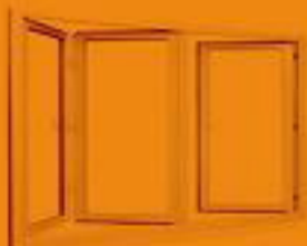
آکار دوتی سه لنگه