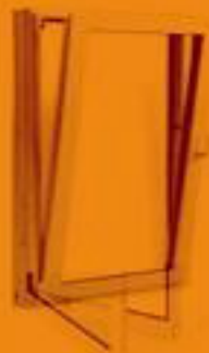
لولایی دو حالت

10 امکان استفاده از پروفیل رنگی با تناسب به دیزاین داخل و نمای ساختمان با قابلیت ثبات رنگ در شرایط مختلف محیطی (سیستم کشویی و باز شو)