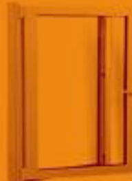
لولایی تک حالت